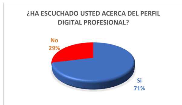
Gráfico 3. Tercera pregunta: Indicador porcentual del conocimiento sobre el perfil digital profesional.

La mayoría de la población entrevistada indicó tener un conocimiento referente al perfil digital profesional reflejando en 71,4%, por otro lado, el 28,6% no conoce acerca de que trata un perfil digital profesional, reflejando un alto conocimiento entre la población que se le aplicó la encuesta.