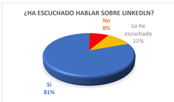
Gráfico 5. Quinta pregunta: Indicador porcentual de conocimiento de la aplicación LinkedIn.

En vista general, la mayoría de las personas que participaron en la encuesta en un 80,6% han escuchado sobre LinkedIn, luego un 11,1% de los individuos que ayudaron llenando la encuesta han escuchado acerca de la aplicación y por el ultimo 8,3% no han escuchado sobre esta aplicación.