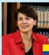
Entrevistado: Dra. Rosalía Arteaga Serrano ECUADOR