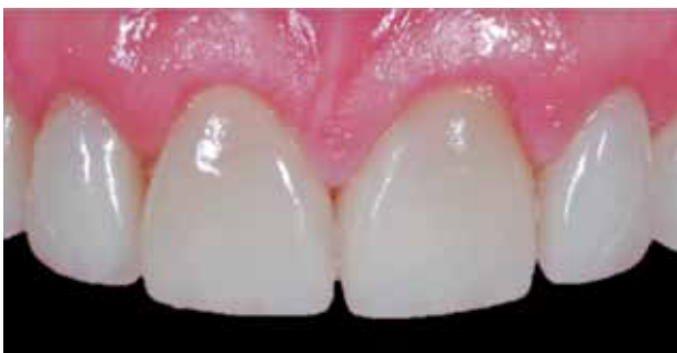
Fig. #15. Carillas inmediatamente postcementación.