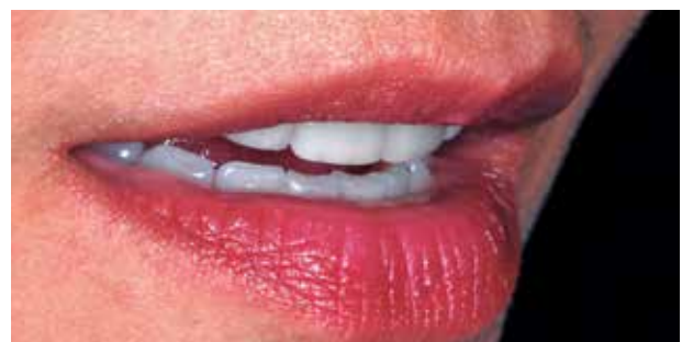
Fig. #18. Labios en reposo a 45 grados.