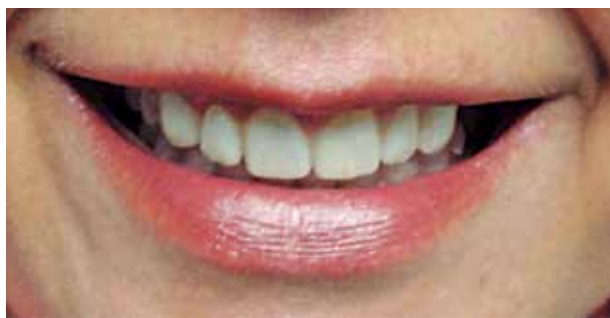
Fig. #13. Sonrisa natural de la paciente con provisionales.