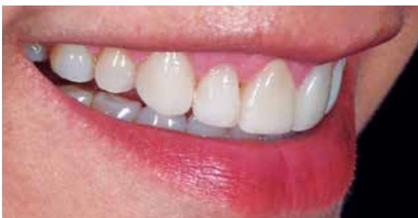
Fig. #17. Sonrisa a 45 grados.