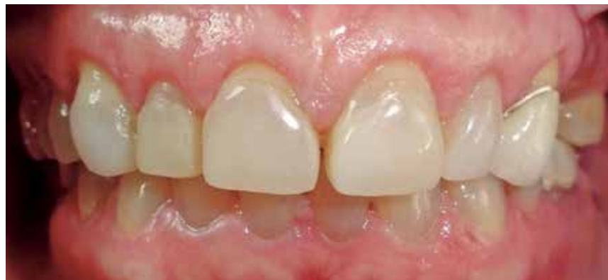
Fig. #10. Revisión a dos meses de recontorneo gingival.