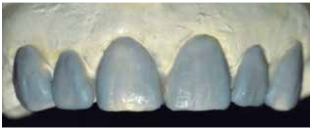
Fig. #11. Encerado de diagnóstico.