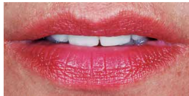
Fig. #16. Foto labios en reposo.