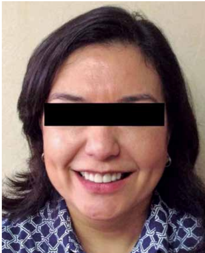
Fig. #19. Final de cara completa sonriendo.