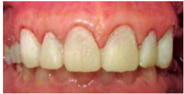
Fig. #12. Provisionales.