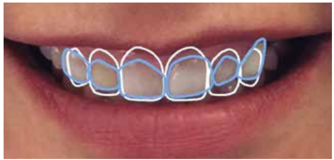
Fig. #7. Diseño de forma anatómica.