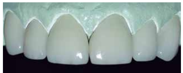
Fig. #14. Envío de laboratorio de carillas y corona de disilicato de litio.