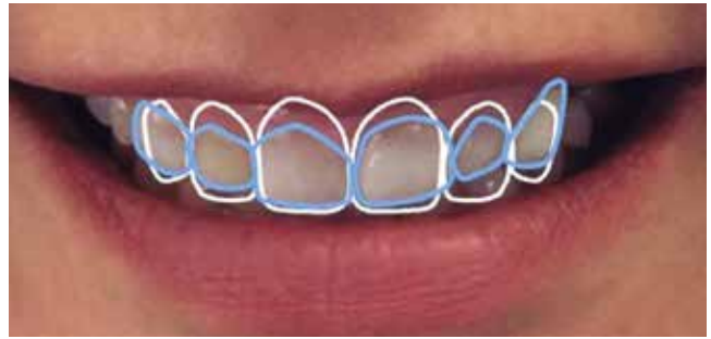
Fig. #7. Diseño de forma anatómica.