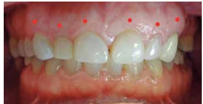
Fig. #8. Erupción pasiva alterada.