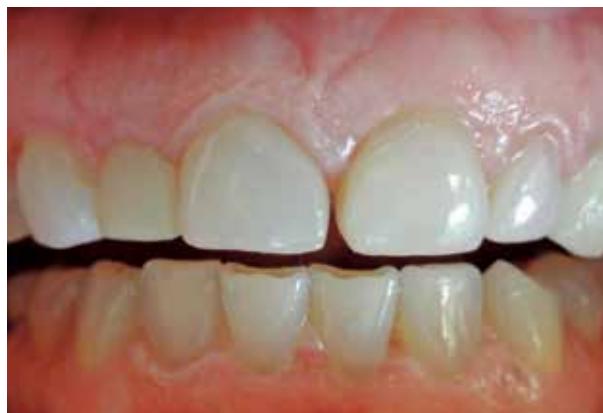
Fig. #5. Dientes separados.