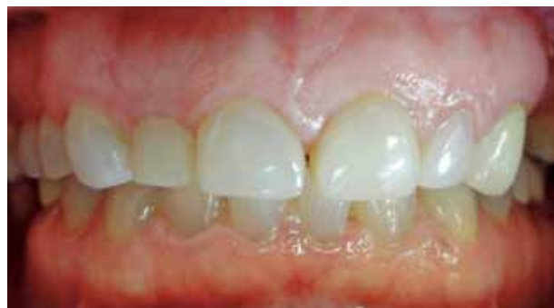
Fig. #4. Dientes en oclusión.