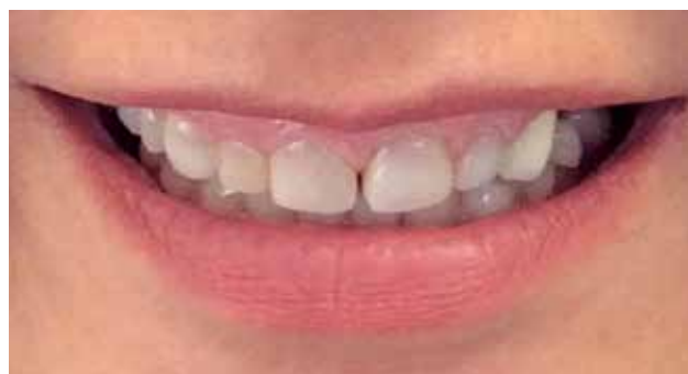
Fig. #2. Sonrisa máxima.