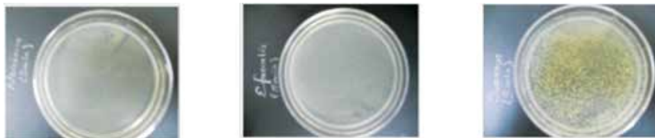
Resultados a los 5 min de exposición del esterilizante.