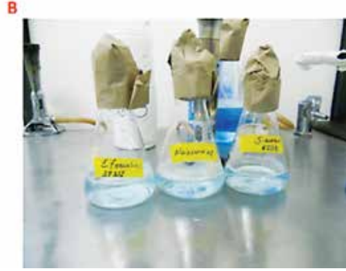
B) Matraces inoculados con tiempo de contacto de 5 y 30 min.