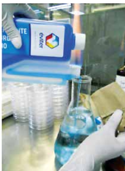
Figura 1. Preparación del esterilizante quirúrgico frío con agua estéril.