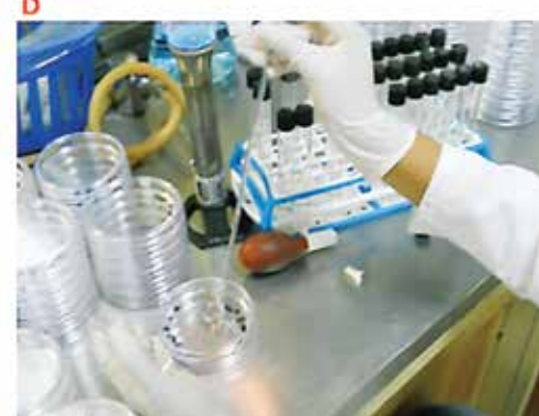
D) Depósito de alícuota de 0,1 mL por vaciado en placa.