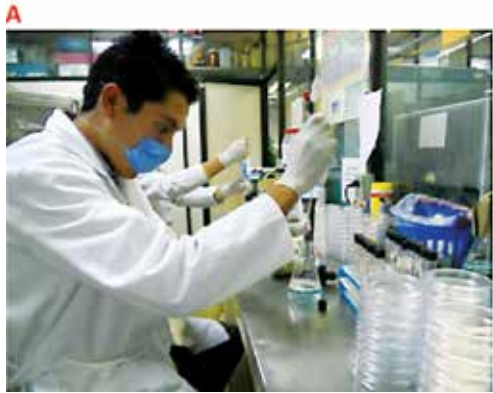
A) Inoculación de los matraces con los microorganismos de prueba.