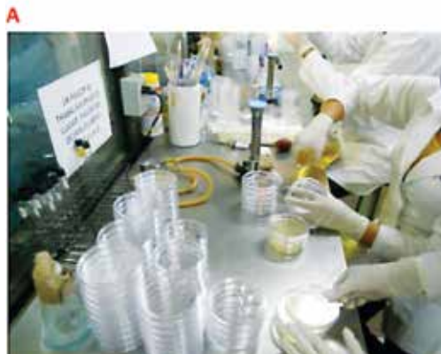
A) Siembra de cultivo en agar soya tripticaasa.