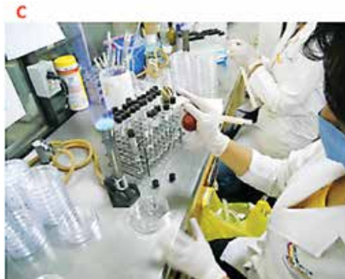
C) Tubo de ensayo con 1 mL del inóculo en 9 mL de agua estéril.