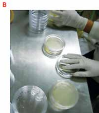
B) Homogenización y solidificación a temperatura ambiente para su incubación.