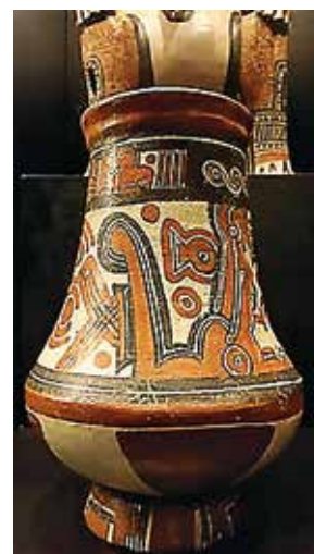
Figuras 5 y 6 - Piezas de cerámica con dibujo de Serpiente Emplumada, propiedad del INS

Todos los pigmentos eran naturales; se obtenían principalmente al moler piedras negras, rojas y blancas y mezclarlas posteriormente con agua y arcilla, aunque no se descarta el uso de pigmentos provenientes de ciertas plantas.