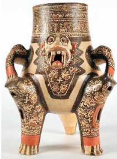
Figura 7- Nótese en la gráfica la representación de la transformación de la figura humana en la de un jaguar. La pieza posee rasgos humanos –orejas, cejas, pestañas, entre otros- combinados con los del animal

Por eso en las representaciones de cerámica, vemos incluso la transmutación de un hombre en jaguar. Figura 7