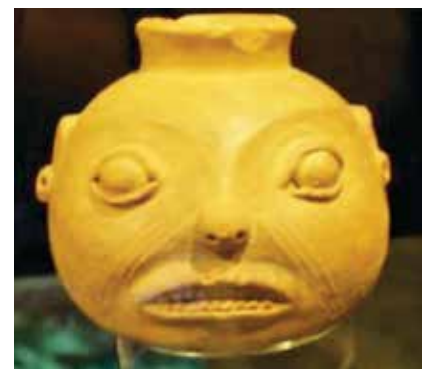
Figuras 24 y 25- Vasijas propiedad del Museo de Jade del INS.