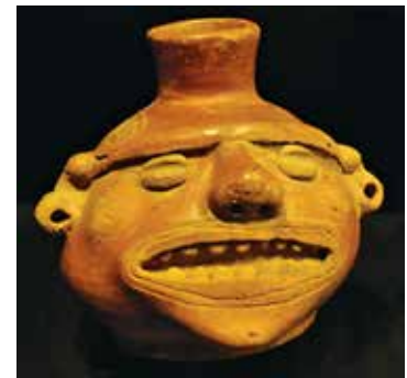
Figuras 8 y 9 - Pieza de cerámica precolombina de la colección del Museo de Jade del INS, procedente de la zona de Guanacaste

Para las culturas precolombinas, los dientes eran –como lo son en nuestros días- motivo de orgullo y valioso tesoro. El contorno, apariencia y calidad de los dientes, marcaban en algunos casos la clase social, rango, condición económica, religiosidad o preferencia de su dueño.