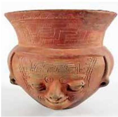
Figura 23- Vasija sonriente de la región de Guanacaste, Costa Rica, propiedad del Museo de Jade del INS, semejante en su forma y expresión a las Sonrientes del sitio de Las Remojadas, México.

Volviendo a Costa Rica, tal y como lo precisan Fernando Camacho Mora y Jeffry Peytrequín Gómez en un documento titulado: Acercamiento a la cerámica precolombina de Guanacaste, Costa Rica. Un recuento, "la secuencia cronológica precolombina para el actual Guanacaste se ha hecho realizando asociaciones tanto con datos cerámicos como con fechas calibradas de Carbono 14 (C14) . Figura 23