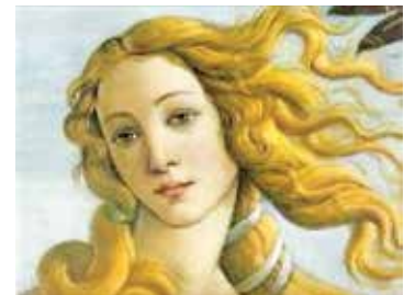
Figuras 13, 14 y 15- La mayoría de los rostros de las pinturas y obras de arte del Renacimiento e incluso de épocas anteriores, muestran rostros serios y en ocasiones adustos. (Fotos con fines ilustrativos)

Ante la escasez de sonrisas en las expresiones pictóricas, cerámica y esculturas de la Antigüedad, en especial del Viejo Continente, algunos estudiosos presumen que ello se debió a que padecían de una mala higiene dental, por lo que se avergonzaban de mostrar su dentadura y, por ende, mantenían la boca cerrada.