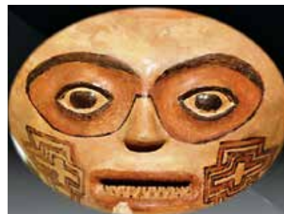
Figuras 19 y 20- Piezas de cerámica consideradas como “objetos funerarios” en las cuales destaca el detalle de los ojos hundidos y el rictus de la boca, mostrando los dientes. (Colección del Museo de Jade del INS, foto: Barzuna y Nuñez).

queológico y un estilo artístico que floreció en el estado mexicano de Veracruz, en el Golfo de México, en un período estimado entre el 100-800 d. C. La cultura de Las Remojadas es como expresión de la cultura clásica mesoamericana.