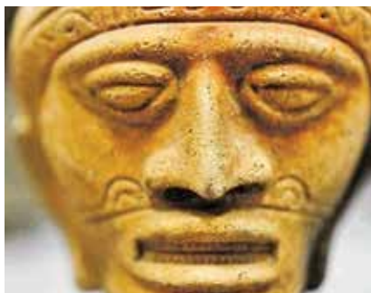
Figura 26- Pieza precolombina donde resalta el detalle de la boca y dentadura expuesta, perteneciente a la colección del Museo de Jade del INS.