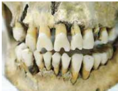
Figura 10- Las decoraciones dentales eran frecuentes entre los indígenas mesoamericanos y, entre otras cosas, indicativas de su clase social o rango. (Foto: Barzuna-Núñez, restos óseos propiedad del Museo Nacional de Costa Rica)

Por ello los indígenas mesoamericanos los adornaban con incrustaciones o limados de las más diversas formas. Figura 10.