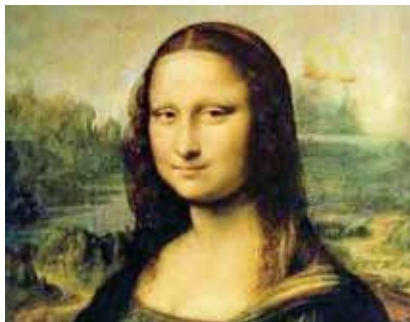
Figura 16- La enigmática sonrisa de la Mona Lisa. (Foto con fines ilustrativos)

Incluso en uno de los cuadros más famosos de la historia, el de la Mona Lisa de Leonardo Da Vinci, la enigmática sonrisa es apenas un esbozo, donde no existe más que una leve inclinación de las comisuras labiales. Figura 16