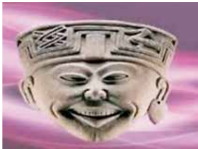
Figuras 21 y 22 - Figurillas sonrientes pertenecientes al sitio de Las Remojadas, encontradas en México

Volviendo a Costa Rica, tal y como lo precisan Fernando Camacho Mora y Jeffry Peytrequín Gómez en un documento titulado: Acercamiento a la cerámica precolombina de Guanacaste, Costa Rica. Un recuento, "la secuencia cronológica precolombina para el actual Guanacaste se ha hecho realizando asociaciones tanto con datos cerámicos como con fechas calibradas de Carbono 14 (C14) . Figura 23