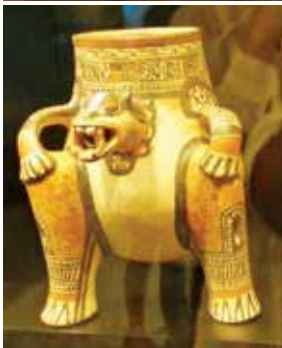
Figuras 2, 3 y 4 -Vasijas trípodes de la colección del Museo de Jade del INS, donde destaca la figura del jaguar

Posteriormente, durante el Período Policromo Tardío -1200 a 1500 d. C.- tal y como lo reseña Botey Sobrado, se suceden grandes cambios en las figuras artísticas plasmadas en la cerámica, entre los cuales sobresalen la imagen de la Serpiente Emplumada y de varias deidades relacionadas con la guerra o el agua, y se introduce el uso de colores de tonalidades azul, grisáceo, negro y naranja rojizo sobre fondo crema. Figuras 5 y 6.