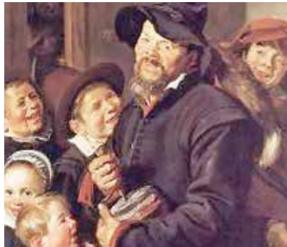
Figuras 17 y 18- El retratista Franz Halls es uno de los pocos pintores que durante el Renacimiento, captó a los modelos de sus cuadros sonriendo y mostrando sus dientes.

culturas que habitaron el área mesoamericana y en este caso, nos llevan a las salas de exhibición y a las bodegas tanto del Museo Nacional de Costa Rica como del Museo de Jade, del Instituto Nacional de Seguros.