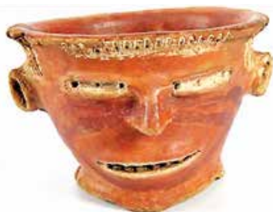
(Figura 1) Pieza de cerámica precolombina del tipo denominado "Zoila" descubierta en la zona de Turrialba.

En diversas localidades costarricenses aparecen también en contextos funerarios, vasijas y demás artículos tales como la cerámica "Zoila" de Turrialba, algunas de cuyas piezas que datan de 700 a 1000 d. C. se exhiben en las salas